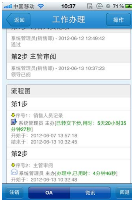
图 8. 工作流程查看