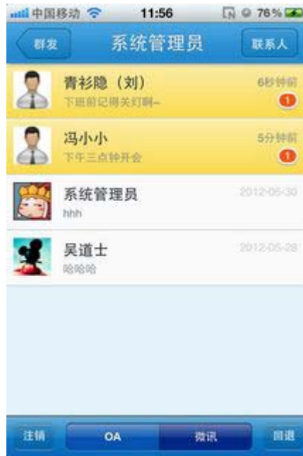
图 5. 微信模块主页