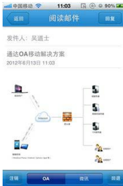
图 2. 邮件阅读界面