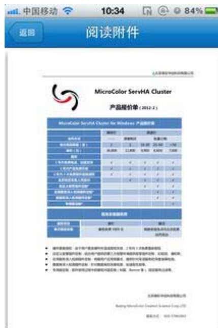
图 4. 附件阅读界面

2. 附件阅读：完美支持 Word、Excel、PPT 等 Office 文档和 PDF 等多种格式附件的在线阅读。同时支持图片附件保存到本地相册的功能。