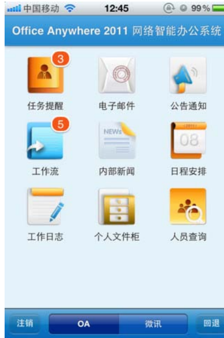
图 1. OA 精灵移动版主页