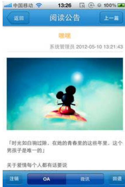
图 3. 公告阅读界面

2. 附件阅读：完美支持 Word、Excel、PPT 等 Office 文档和 PDF 等多种格式附件的在线阅读。同时支持图片附件保存到本地相册的功能。