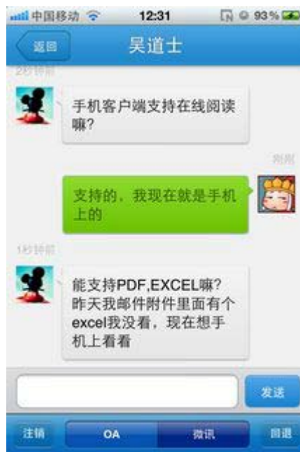
图 6. 微信对话界面

4. 工作流：全新的工作流模块设计，更加理想的支持了表单内容的展示，支持选人、转交、会签等工作流操作。随时随地处理工作，让移动办公真正简单可行。