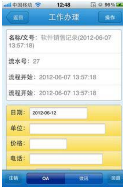
图 7. 工作流办理模块